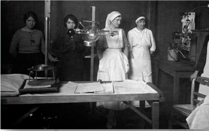
MARIE CURIE ET SA SALLE DE RADIO