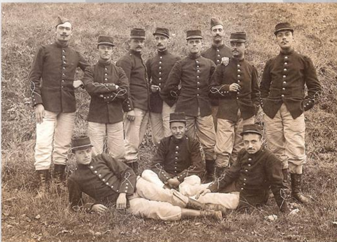
SOLDATS DU 228 ÈME RÉGIMENT D'INFANTERIE