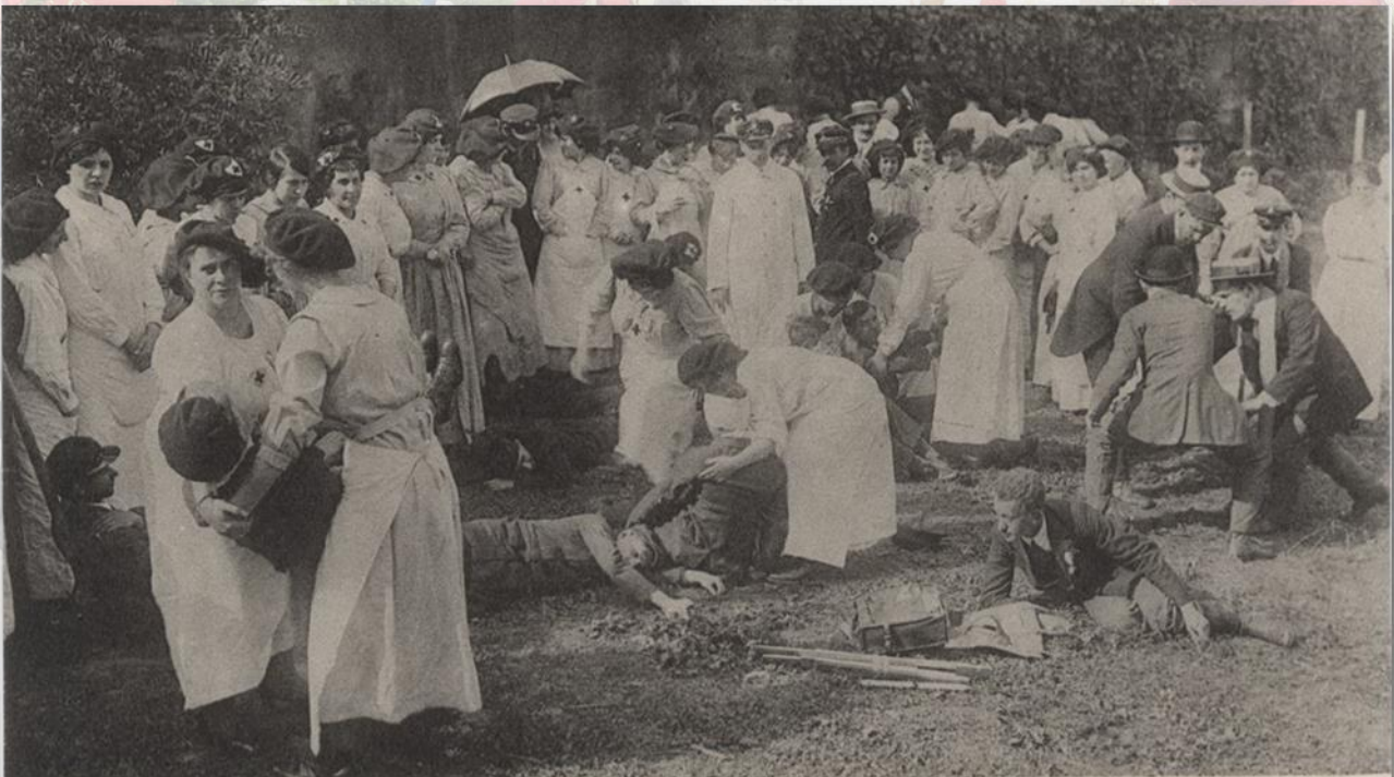
12. La Grande Guerre 1914 — École d'Ambulanciers de la Croix Rouge School of Ambulanciers of the red Cross