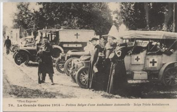
"Phot-Express" 76. La Grande Guerre 1914 — Prêtres Belges d'une Ambulance Automobile - Belas Priests Ambulanciers