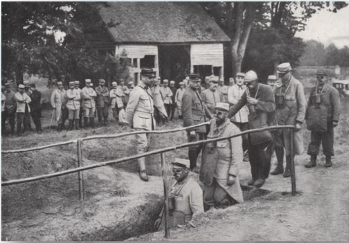
FORMATION À L'UTILISATION DES MASQUES À GAZ