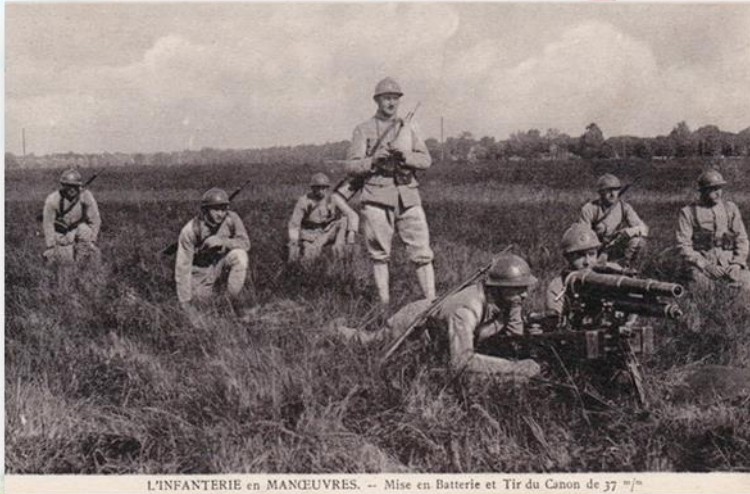
L'INFANTERIE en MANŒUVRES. -- Mise en Batterie et Tir du Canon de 37 mm