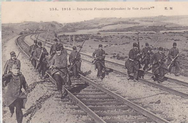
234. 1914 — Infanterie Française défendant la Voie Ferrée