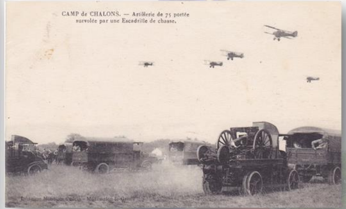
CAMP de CHALONS. — Artillerie de 75 portée surveillée par une Escadrille de chasse.