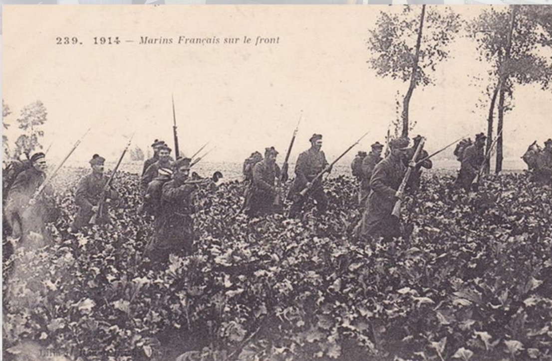
239. 1914 — Marins Français sur le front