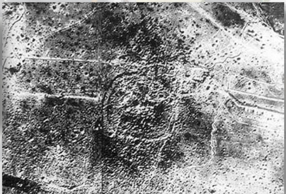
OUVRAGE DE THIAUMONT