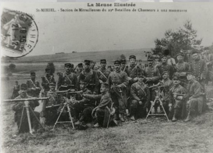
La Meuse illustrée St-MIHIEL. - Section de Mitrailleuses du 1 er Bataillon de Chasseurs à une manœuvre