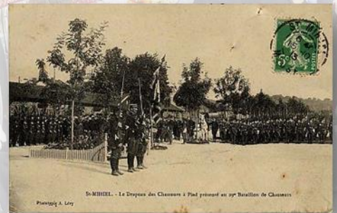
St-MIHIEL. - Le Drapeau des Chasseurs à Pied présent au 1 er Bataillon de Chasseurs