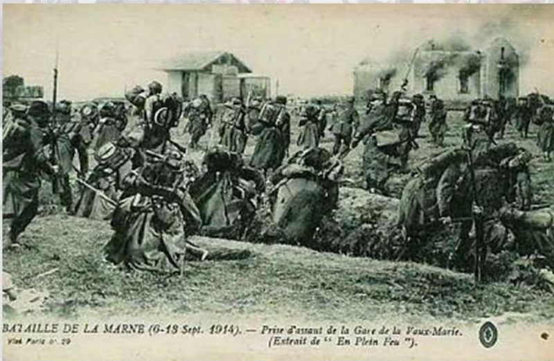
BATAILLE DE LA MARNE (6-19 Sept. 1914). — Prise d'assaut de la Gare de la Vierge-Marie. (Extrait de "En Plein Feu").